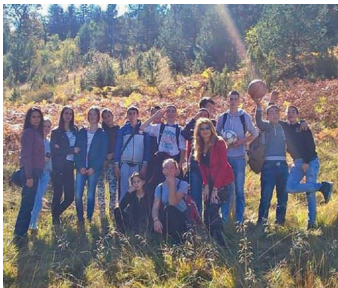
Час у природи - октобар 2018.