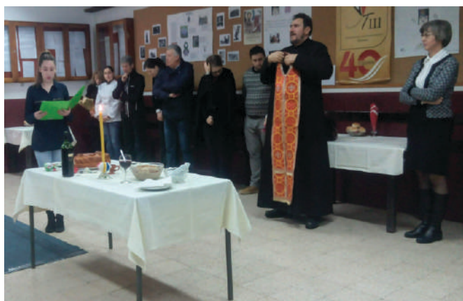
Прослава Савиндана 2019.