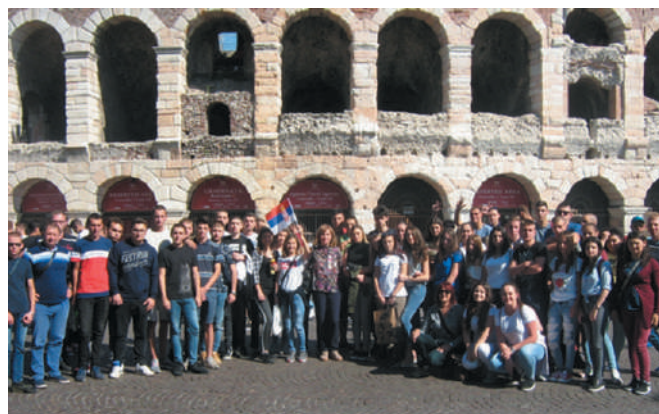
Верона – град Ромео и Јулије, 29. 09. 2018.

У пратњи туристичког водича обишли смо град Ромео и Јулије: тргове Бра и Ербе, Арену, Дантеов трг, Ромеоу и Јулијину кућу. Затим смо имали слободно време за индивидуалне обиласке и фотографисање. У вечерњим сатима смо се вратили у Лидо ди Јесола и имали слободно време за шетњу, куповину и дружење.