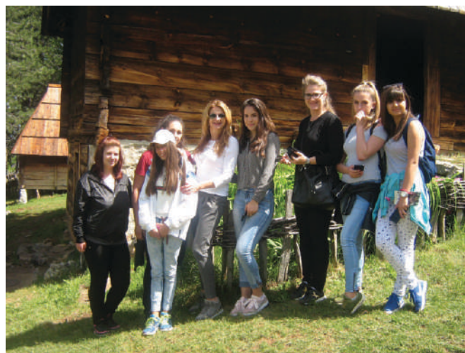
Музеј Старо село - Сирогојно - мај 2018.