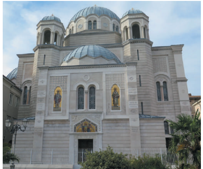
Црква Светог Спиридона - Трст

Трст је град и лука у Италији на обали Јадранског мора. У њему живи око 210.000 становника. Од Љубљане је удаљен око 95 километара. Градске знаменитости су старо градско језгро из 18. века са већим бројем тргова, цркава, палата, здања и споменика.