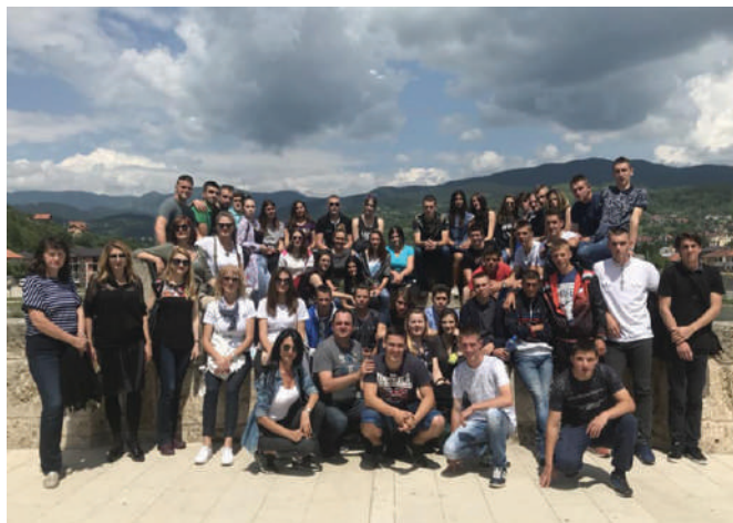
Матурски излет у Вишеград - мај 2018.