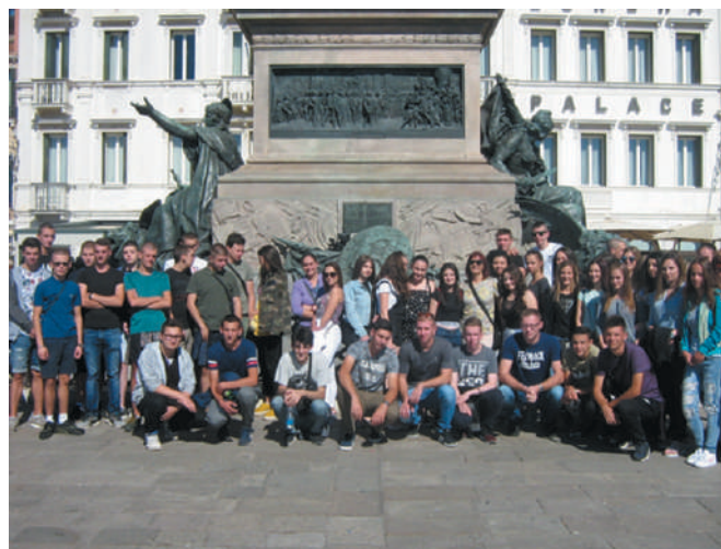
Матуранти наше школе у Венецији

Обишли смо Цркву Светог Марка, која је најпознатија црква у Венецији. Црква је фасадом окренута ка Тргу Светог Марка, док се остатак грађевине налази у склопу комплекса Дуждове палате. Затим смо обишли Дуждеву палату, мост уздисаја, канал Гранде и мост Риалто. Мост је један од важнијих симбола Венеције. На мосту се налази мноштво малих продавница, сувенирница и радњи са производима направљеним од “мурано” стакла. Након организованог обиласка имали смо слободно време до 16.00 часова, када смо се вратили у Лидо ди Јесола. У вечерњим часовима организовано смо отишли у дискотеку, где смо се забављали уз звуке наше и италијанске музике.