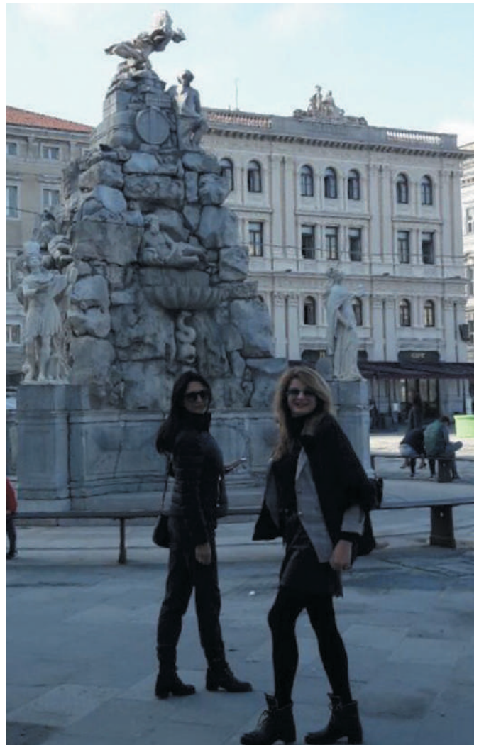
Трг уједињења у Трсту