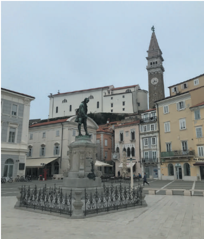
Споменик Ђузепеу Тартинију у Пирану

Обишли смо и Пиран, градић у словеначком приморију са низом тргова, црква и палата. У римско доба био је насељен Илирима.