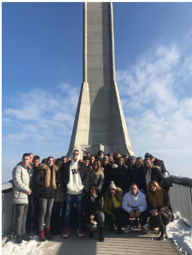
Излет на Авалу - децембар 2018.