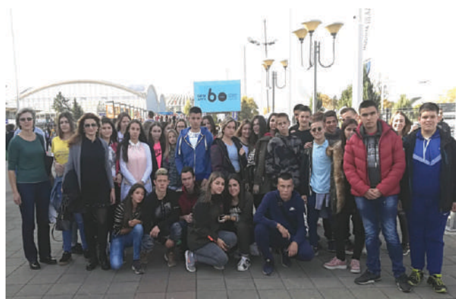
Посета Сајту књига у Београду - октобар 2018.