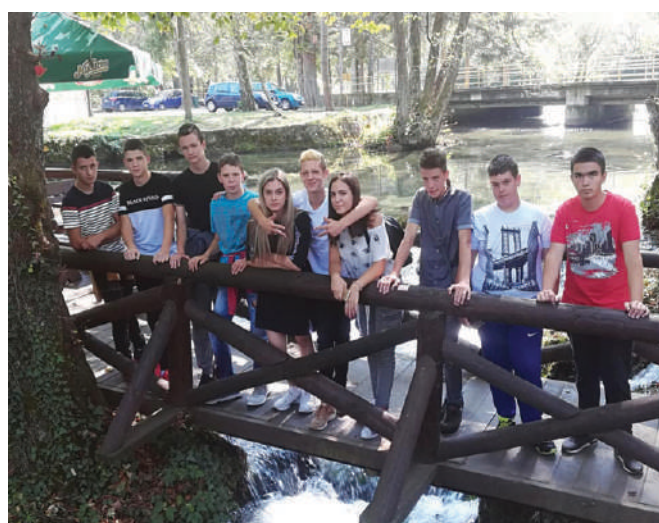
Река Врело (Година) - септембар 2018.