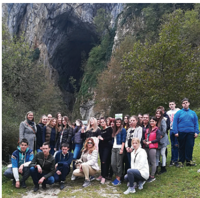
Потпећка пећина - октобар 2018.