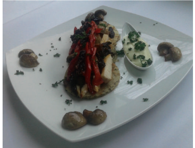
Медаљони од хељде - Кухињски калфа