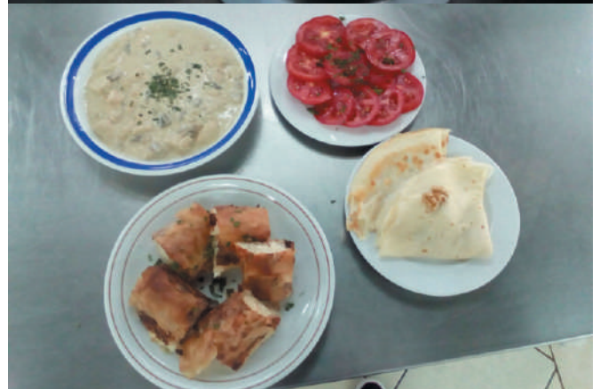
Матурски радови неких од наших ученика - јун 2018.